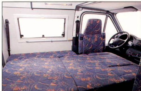
Zur Liegefläche umgebaute Sitzgruppe.