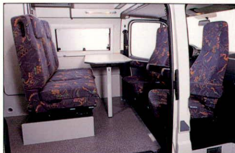
Sitzgruppe mit gedrehten Fahrerhausitzen.