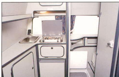
Heckansicht mit Küche und Naßzelle.