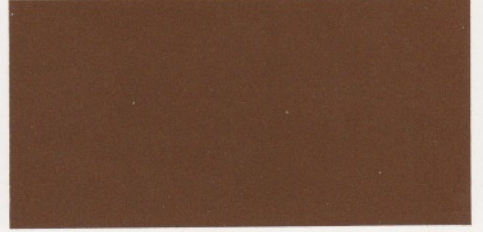
Goldmetallic* – verfügbar mit den Polsterfarben: 1, 2