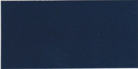
Marineblau – verfügbar mit den Polsterfarben: 1, 2, 3