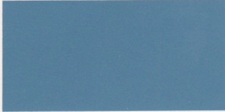
Hellblauetallic* – verfügbar mit den Polsterfarben: 1, 2, 3