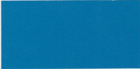
Monza-Blau – verfügbar mit den Polsterfarben: 1, 2, 3