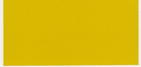
Daytona-Gelb – verfügbar mit den Polsterfarben: 1, 2