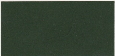
Dunkelgrünmetallic* – verfügbar mit den Polsterfarben: 1, 2