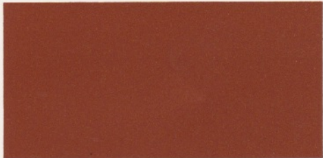
Kupferbraunmetallic* – verfügbar mit den Polsterfarben: 1, 2