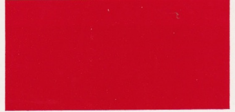
Hellrot – verfügbar mit den Polsterfarben: 1, 2